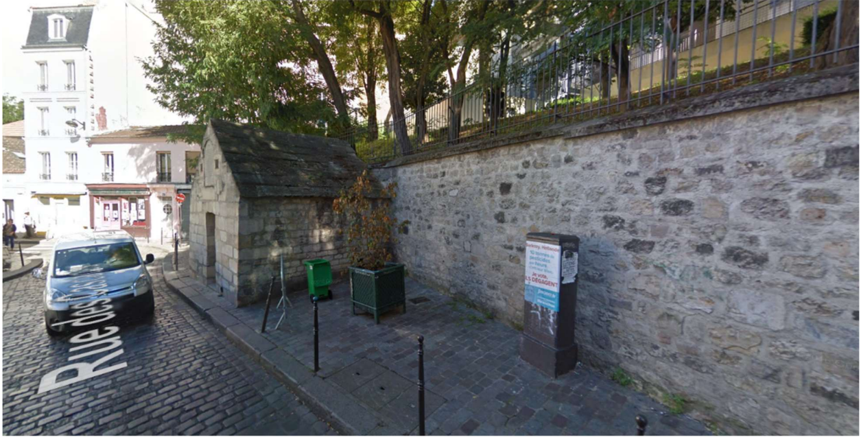
Rue des Cascades, Paris