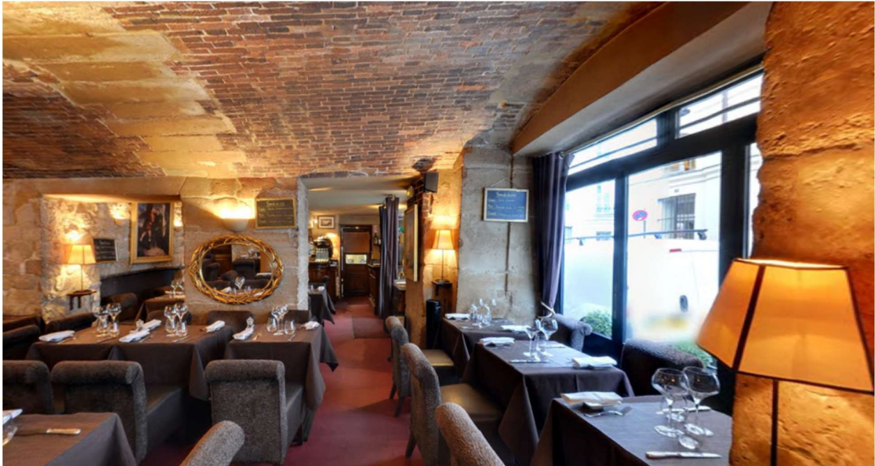
Rest. A Casaluna, Paris